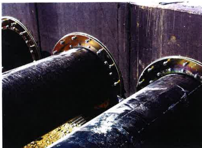
Beispiel Dichtungen mit Fest-Losflansch

Vorbaumauerhülsen dienen der Schaffung einer Hülse vor der Wand. Hier kann dann eine Ringraumdichtung eingesetzt werden. Alle Vorbaumhülsen werden inkl. Dübeln, Schrauben und Spezial-Dichtungsmittel zur Wandabdichtung ausgeliefert.