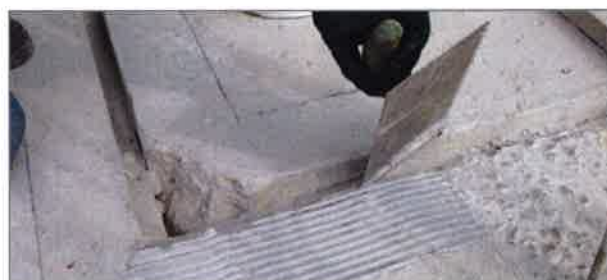
■ 2. Aufbringen des Grundauftrags