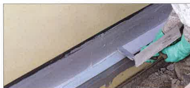
■ 5. Aufbringen des Deckauftrags