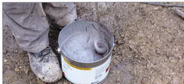
■ 1. Anmischen des Tricoflex® Systemklebers FU 60

Das Tricoflex® Abklebesystem zeichnet sich durch seine einfache Verarbeitung aus. Der Untergrund muss frei von Trennschichten sowie von losen/minderfesten Bestandteilen sein. Das Aufbringen des Tricoflex® Abklebesystems erfolgt in den Arbeitsschritten der nebenstehenden Abbildungen.