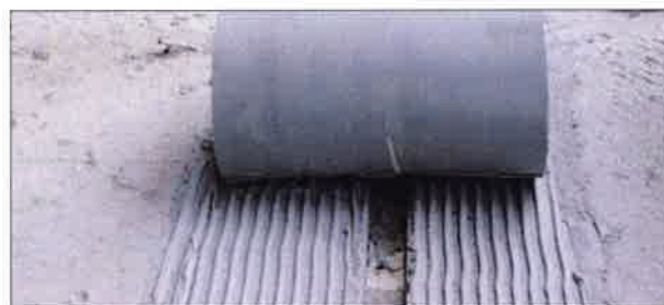
■ 3. Einbringen des Dichtelements