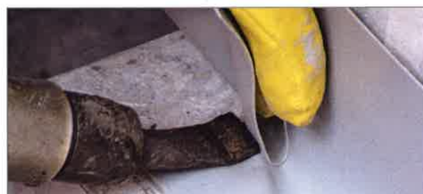
■ 4. Verbinden der Dichtelemente durch Schweißen