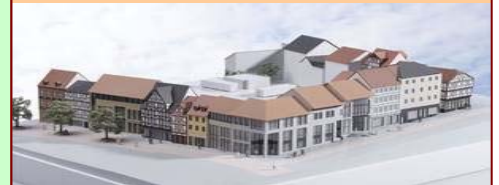
Stad Galerie, Eschwege