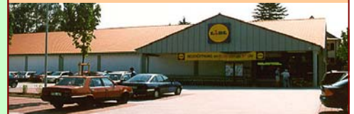
Lidl Markt, Herzberg/Harz