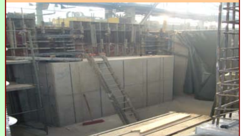
RMW Maschinenfabrik, Rotenburg/F.